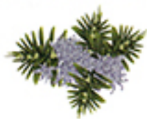
ローズマリー エキス

シソ科植物マンネンロウの葉や花から抽出されるエキスで芳香性があります。うるおいを保ち、頭皮と毛髪を健やかに保ちます。