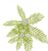
セイヨウ ノゴザリソウエキス

シソ科植物マンネンロウの葉や花から抽出されるエキスで芳香性があります。うるおいを保ち、頭皮と毛髪を健やかに保ちます。